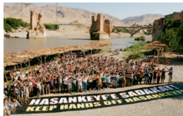
ECA Watch Austria